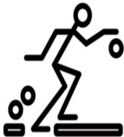
JBC Boskants Boeleke